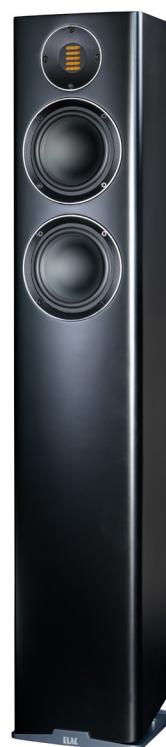
Vorderseite Carina FS247.4