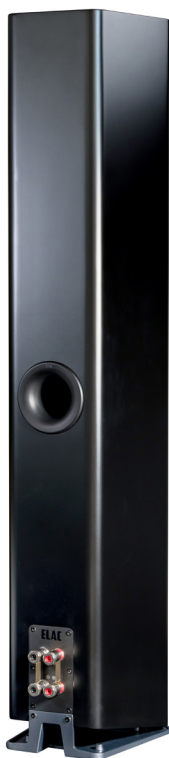
Rückseite Carina FS247.4