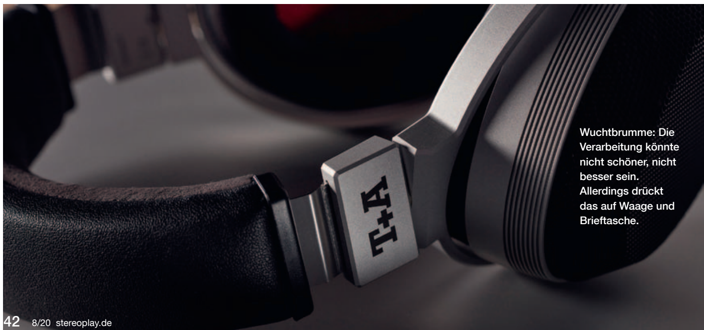
Wuchtbrumme: Die Verarbeitung könnte nicht schöner, nicht besser sein. Allerdings drückt das auf Waage und Brieftasche.