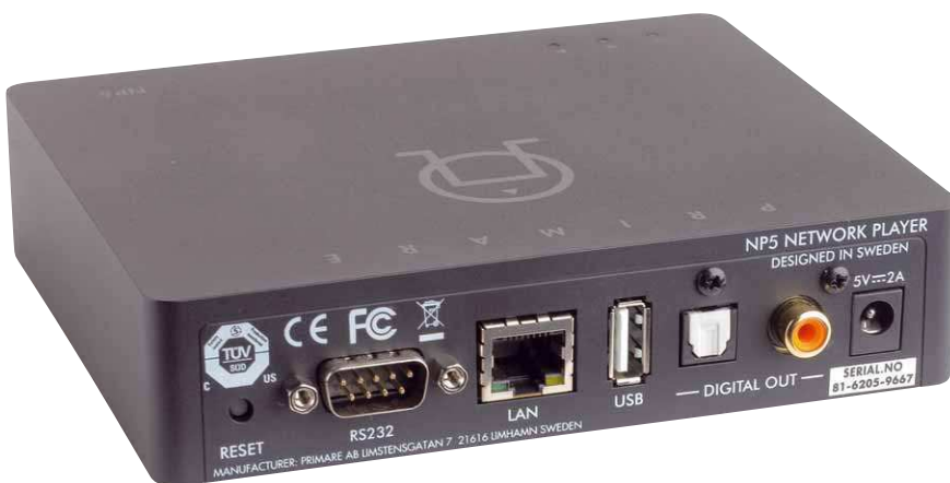
Auf einen USB-Ausgang verzichtet man beim NP5 doch auch mit den beiden S/PDIF-Varianten ist der kleine Streamer schon gut aufgestellt

gering zu halten. Der Bildschirm wird in drei Segmente aufgeteilt, die das Wahren der Übersicht besonders erleichtern. Am unteren Bildschirmrand findet man das momentan laufende Lied und alle Wiedergabefunktionen. Links gibt es Zugriff auf alle verbundenen Quellen und rechts bleibt viel Raum zur Navigation durch die ausgesuchten Musikspeicher, wobei sogar die Größe der Cover oder Ordner in vier Stufen angepasst werden kann. Eine Wort- und eine Buchstabensuche erleichtern zusätzlich das Finden des gewünschten Albums.