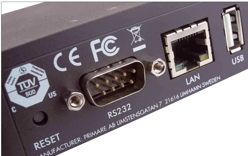
Mithilfe des RS232-Anschlusses können Steuersignale an verbundene Primare-Geräte weitergeleitet werden

hier also das Maximum geboten, das mit den beiden Übertragungsvarianten möglich ist. Sollte das angeschlossene Gerät damit jedoch überfordert sein, weil es eventuell schon ein wenig älter ist, lässt sich das Ausgabesignal auch auf 48 oder 96 kHz begrenzen. Wer weitere Geräte von Primare nutzt, kann außerdem den RS232-Anschluss nutzen, um beispielsweise die Lautstärke des Verstärkers mit der App des Streamers zu steuern.