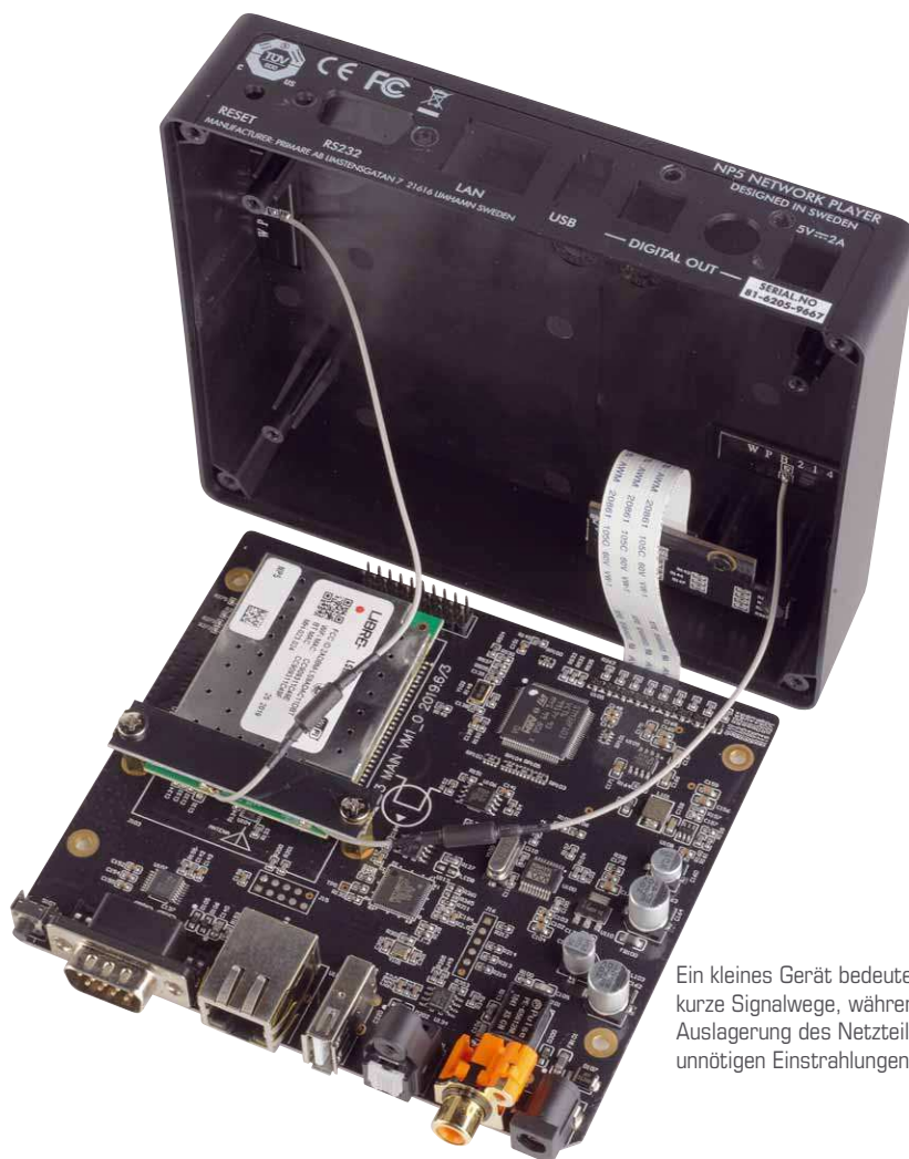
Ein kleines Gerät bedeutet auch kurze Signalwege, während die Auslagerung des Netzteils vor unnötigen Einstrahlungen schützt

schließlich bei der Nutzung von USB. Bei den PCM-Samplingraten sind dann wieder alle Anschlüsse identisch und ermöglichen die Verwendung von maximal 192 kHz bei 24 Bit. Verstärker mit digitalen Anschlüssen bekommen