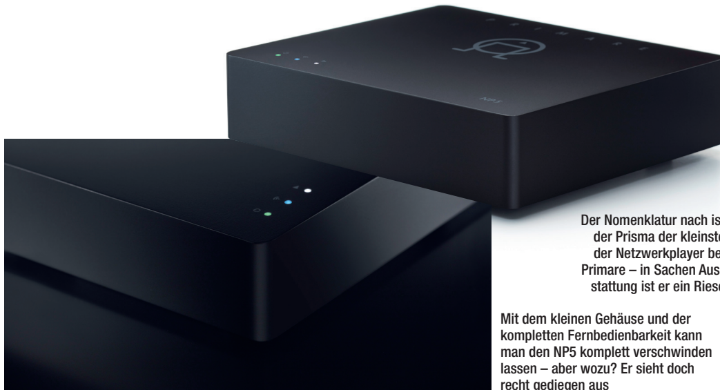
Der Nomenklatur nach ist der Prisma der kleinste der Netzwerkplayer bei Primare – in Sachen Ausstattung ist er ein Riese

Mit dem kleinen Gehäuse und der kompletten Fernbedienbarkeit kann man den NP5 komplett verschwinden lassen – aber wozu? Er sieht doch recht gediegen aus