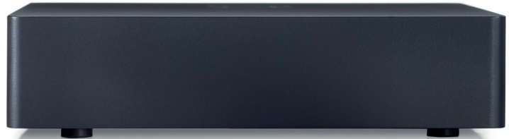
Die Antennen für die Drahtlos-Funktionen sind unter dem Kunststoffdeckel – für die Standfestigkeit sorgt eine Metall-Bodenplatte