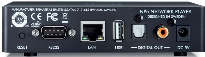
Alle Kabelanschlüsse finden sich an der Rückseite – inklusive RS232-Buchse für die Vernetzung mit anderen Primare-Geräten